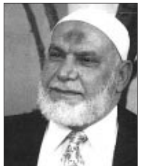
الراحل الشيخ محمد سعد الله الحموي