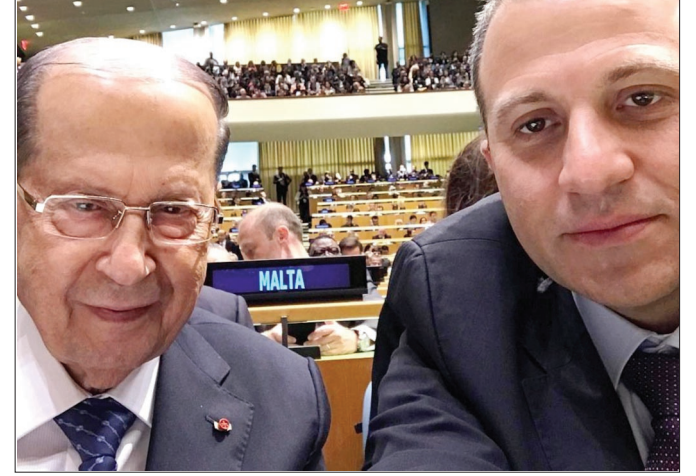
صورة سيلفي تجميع الرئيس عون والوزير باسيل

جاءنا من وزارة الطاقة والمياه (اللبنانية) دعوة نصّها يُبين لماذا هي وما الهدف منها. نص الدعوة: وهذا نصّها الحرفي: «دعوة للتغطية الإعلامية برعاية معالي وزير الطاقة والمياه المهندس سيزار أبي خليل. – وحضور معالي وزير الخارجية والمغتربين المهندس جبران باسيل. – تتشرف وزارة الطاقة والمياه بدعوتكم لحضور حفل تدشين محطة المعالجة ومنظومة الصرف الصحي في نطاق شكا وانفة. – المكان: حرم محطة معالجة الصرف الصحي – شكا. – الزمان: السبت ٢٧/١/٢٠١٨ الساعة ٣:٣٠ بعد الظهر. يرجى تأمين التغطية الإعلامية بيروت في ٢٣/١/٢٠١٨.» كيف يقبل الرئيس؟ وبما أن من الصفات التي يحبها رئيس الجمهورية صفة: «بي الكل». – فهل هذا مسموح له «الكل» إستغلاله؟ – وهل يستطيع ذلك النائب بطرس حرب مثلاً؟ – إننا نسأل وكلنا أمل بأن يصلنا الجواب على السؤال: – هل يقبل الرئيس بهذا الإستغلال؟ – وهل يسمح الرئيس لرئيس التيار الذي أسسه هو «للإصلاح والتغيير» بهذا الإستغلال؟ أم أن «الإصلاح والتغيير» شعار وليس هدفاً؟