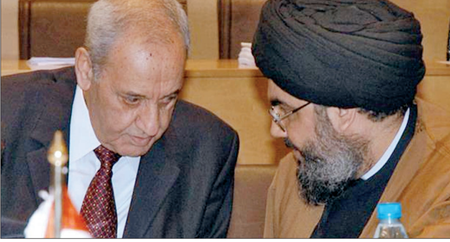
الرئيس نبيه بري والسيد حسن نصرالله

كان «دولة الإستاذ» بين حين وآخر وقضية أخرى يُظهر نفسه وكأنه مستقل ولا علاقة له «حزب الله» بقراراته، واليوم كشف رئيس مجلس النواب نبيه بري أن كل مواقفه السابقة وكل ما كان يقوله كان منسّقاً ومتفقاً عليه مع الحزب. وأن ما كان يجري ليس أكثر من توزيع أدوار بين الحزب وبري: «الله». «أنا برفع السقف وأنت إدخل كوسيط والعكس بالعكس». «هذا ما بيّنه تصريح رئيس مجلس النواب نبيه بري من طهران حيث قال: «... من يريد أن يتكلم معي بشأن التحالف الانتخابي: حفظ الله لبنان وشعبه وحفظ الأمة ووحدتها من نوايا باطنية.» «ومن يريد أن يتكلم مع الحزب بشأن التحالف الانتخابي عليه أولاً أن يتكلم معي». «نحن إثنان بواحد». والشعب ماذا يقول؟ والشعب الوطني غير الطائفي أو المذهبي يقول: حفظ الله لبنان وشعبه وحفظ الأمة ووحدتها من نوايا باطنية.