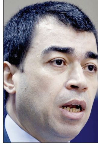
الوزير سيزار أبي خليل