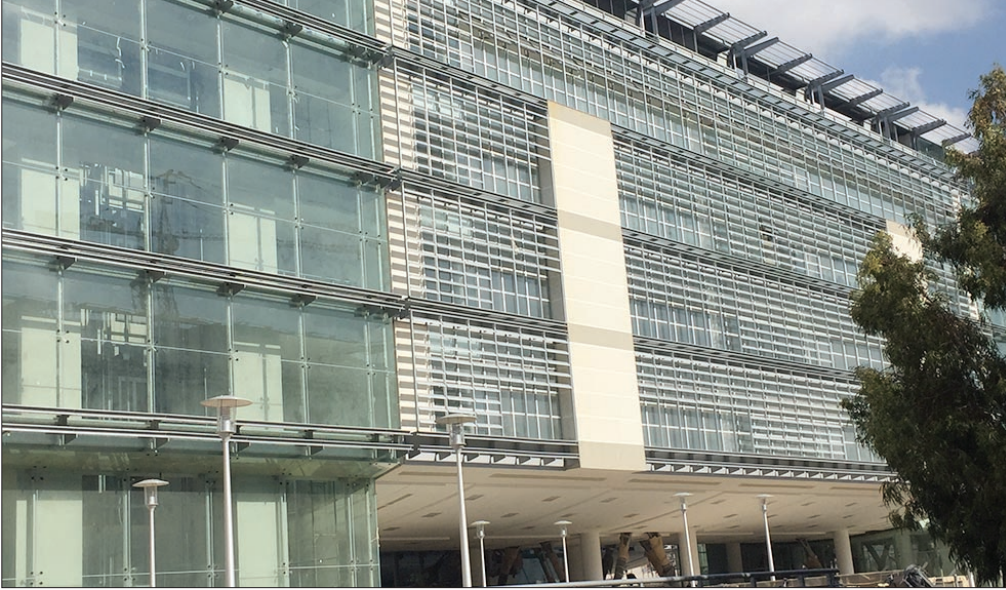
جانب من المبنى الجامعي الموحد

توقع بإنهاء أشغال «الهندسة»، و«الفنون» في شباط و«العلوم» في حزيران وقال: «من المتوقع إنهاء الأشغال في: