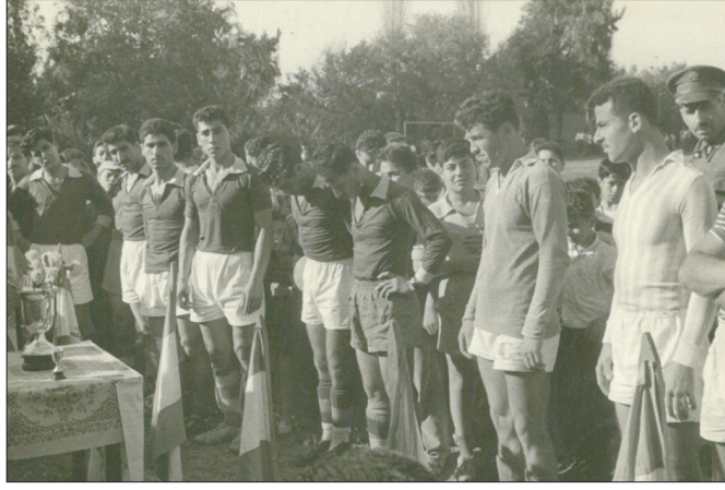
من النشاطات الرياضية في الميناء