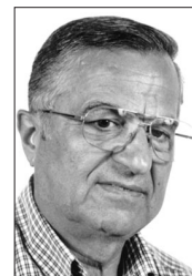
الشاعر جورج أيوب

تأمل المنظر بأعجوبة وعطر البرونزاج من دون لمس ضج وعطا ابيات مكتوبة ويمرقت فتى حدًا ويرمي سلام وطيف المسامك دني بيدو بين الفضا وبرداية الأحلام محتر من أي شمس بدو بجسم حورية الصبا حدو وصورة شمس بالأفق مزروعا قلا شعر تا باستو بخدو ومن يومها عايش على الأحلام وعطرها بينام ويوعي