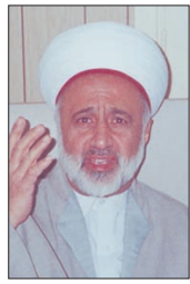
الشيخ خالد بن سنة

«وَقُلْ الْحَقُّ مِنْ رَبِّكَ»، هذا هو النهج السماوي ولكن لا بد من ان تكون الحكمة ضالته ولا يهتما من أي وعاء خرجت طالما ان شريعة السماء توافق عليها: «الحق من ربك فلا تكونن من الممترى».