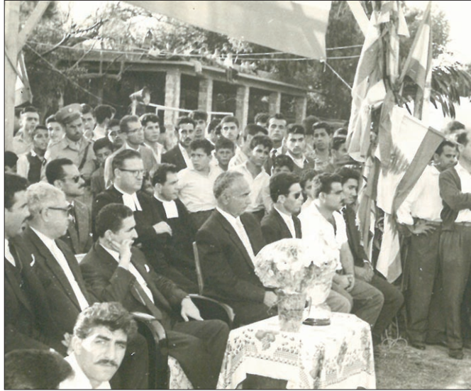
الرئيس رشيد كرامي: البداية (١٩٦٢)