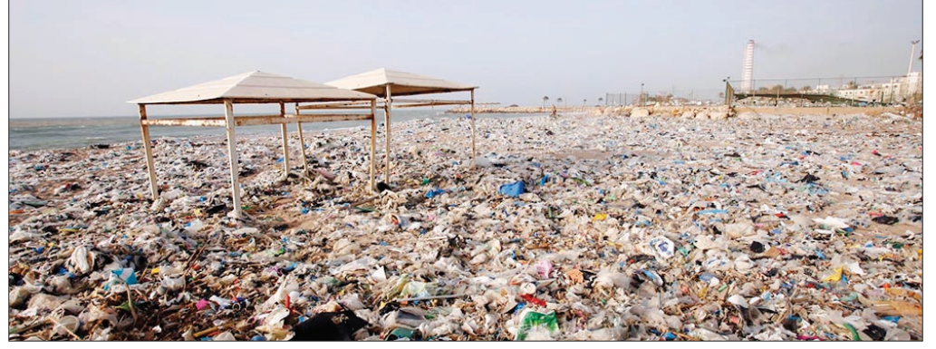
شاطيء كسروان قبل تنظيفه