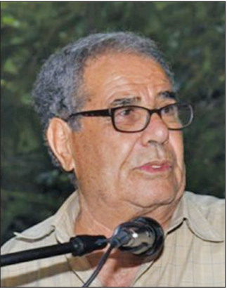
الشاعر عمر شبلي