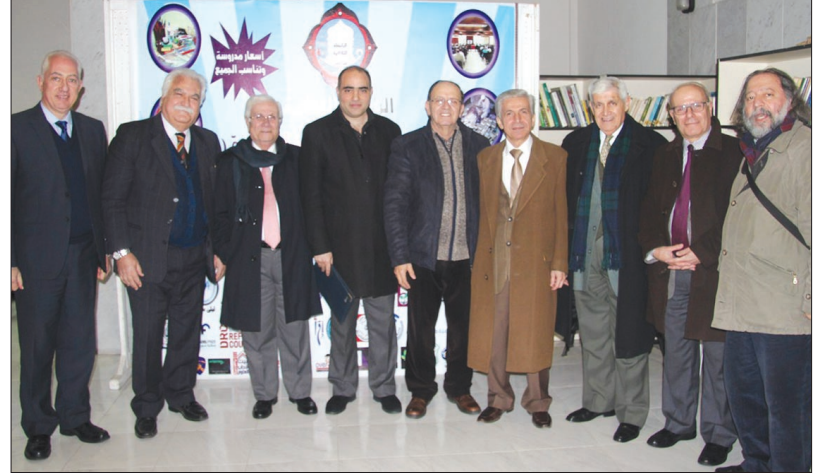
مجموعة من المشاركين في اللقاء