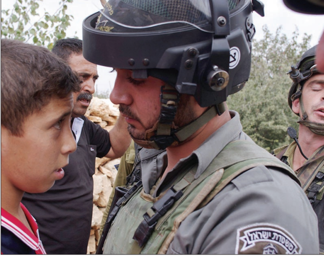
تحتي الطفولة الفلسطينية

تاريخان لهما من الأهمية بمكان، بحيث يفرض على كل مراقب أو محلل أن يبادر إلى طرح السؤال التالي: «القضية الفلسطينية إلى أين»... ولن لا يتابع الوقائع نذكره بأن: ٦ كانون الأول ٦ - كانون الأول من العام الماضي، هو تاريخ إتخاذ الرئيس الأمريكي «ترامب» قراره الشهير، بنقل السفارة الأمريكية إلى القدس كونها عاصمة دولة إسرائيل - حسب زعمه - ٥ كانون الثاني ٥ - كانون الثاني ٢٠١٨ هو تاريخ قرار الإدارة الأمريكية بوقف الدعم المالي إلى «هيئة غوث السلاجطين الفلسطينيين» «الأونروا»، التي تُعنى بمساعدتهم للعيش والصحة والتعليم... «الهجرة».