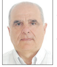
بقلم اللواء أ.د. أمين عاطف صليبا

الأرض منذ ما قبل اكتشافها من قبل «كريستوفر كولومبس» وبآثار لهذا الشعب، الذي هو على حافة الانقراض والنزوح في المجتمع الأمريكي. تلك الأراضي المحمية، والتي تبلغ مساحتها حوالي ١٣٠٠٠ كلم مربع - أي أكبر من مساحة لبنان بحوالي الثلث - كانت قد حظيت بحماية لها بقرارين منفصلين من الرئيسين «كلينتون» و«أوباما» وذلك سندا لقانون الحفاظ على الآثار وصون المحميات الطبيعية على الأراضي الأمريكية، الصادر عام ١٩٠٦ الذي يُجيز للرئيس الأمريكي، ومن خلال قرار عائد له، تحديد مساحة تلك المحميات.