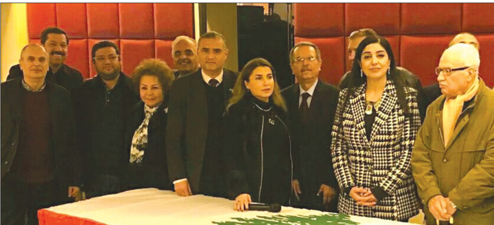
البعض من حضري اللقاء

المدينة، والدفاع عن مصالحها وحقوقها، والسعي إلى رفع الظلم والغبن والاستخفاف والاستهتار اللاحق بها. رابعاً: أكد المجتمعون بأن أبرز الصفات التي يجب ان يتمتع بها أي مرشح في هذه اللائحة، هو ان يكون ولاؤه خالصاً لوجه المدينة، وان يكون مستقلاً، وغير محسوب أو تابع لأي حزب أو تيار من التيارات السياسية التي سوف تتّم مواجهتها وذلك بغية تحقيق التغيير النوعي المنشود الذي يصبو اليه الناس، بعيداً عن التبعية والمحسوبية والاستزلام السياسي.