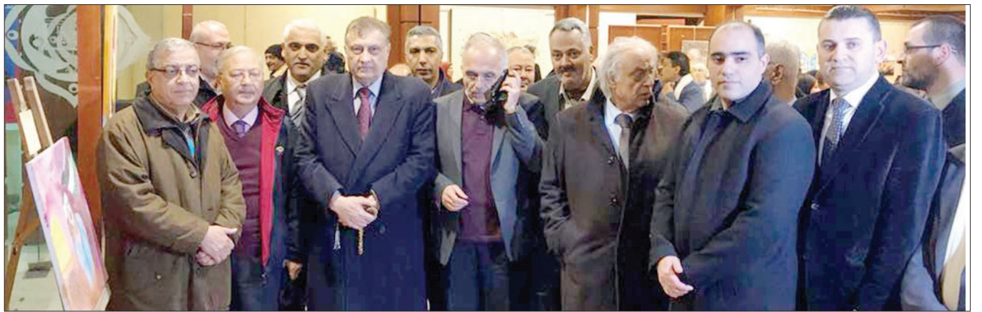
عند افتتاح المعرض