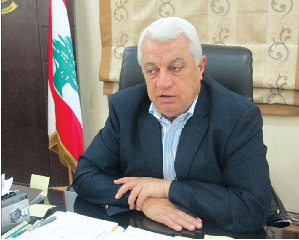
رئيس بلدية طرابلس أحمد قمر الدين يتحدث إلى «التمدن»

والإعمار، جاهز لتلزييم المطمر، وفي الوقت عينه يمكن تأهيل واستخدام بعض المساحات فيه بالتزامن مع الانشاءات اللازمة على الجانب الآخر منه».