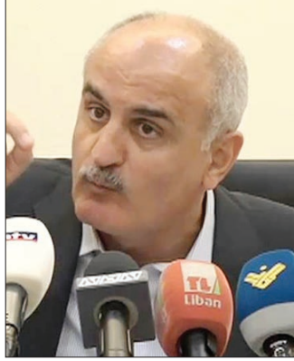
الوزير علي حسن خليل

تجاوز الدستور لا ينفع ويزيد أصحابها إرباكاً ويخلق إشكالات جديدة. وقال: «... ليقرأ معاليه (جريصاتي) القرار حتى لا يكرر الخطأ بالخطأ».