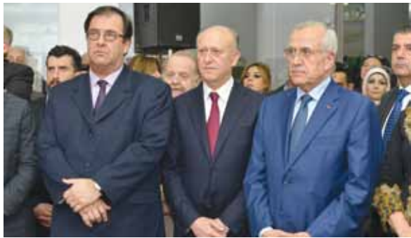
الرئيس ميشال سليمان والوزير أشرف ريفي والسفير الفرنسي برونو فوشيه

السعفة الأكاديمية هي وسام مميز تمنحه الدولة الفرنسية إلى المميزين في مجالات التعليم والثقافة وتضم جوقه حاملي هذا الوسام المميز العديد من الحائزين على جوائز نوبل وغيرها من الجوائز العالمية ويترأس الجوقه رئيس الجمهورية الفرنسية