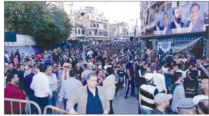
من مهرجان باب الرمل

بأنكم تريدون لائحة قرارها طرابلسي، تحفظ قرار طرابلس، ان تصادروا وتخطفوا قرار اهل المدينة.