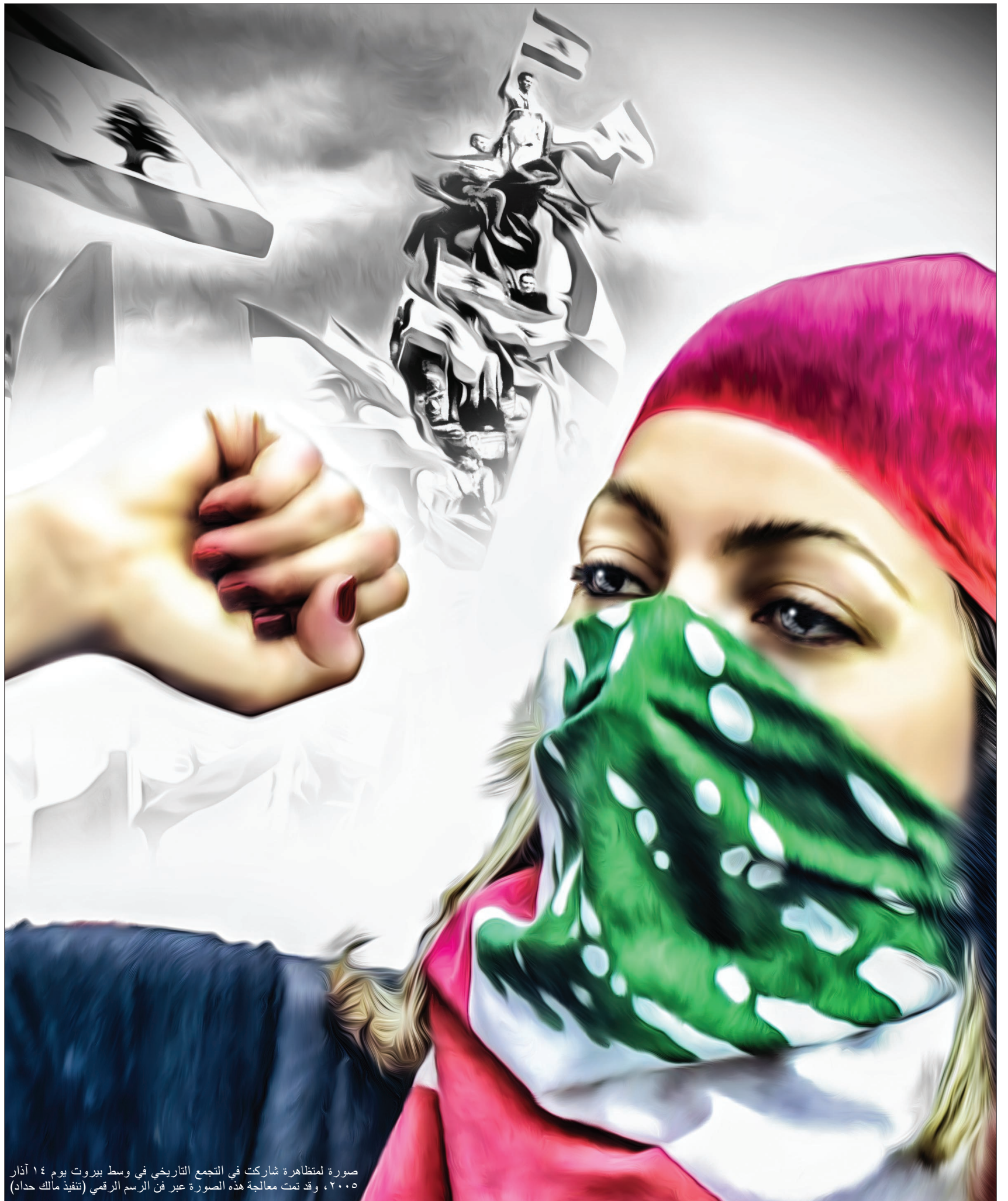
صورة لمتظاهرة شاركت في التجمع التاريخي في وسط بيروت يوم ١٤ آذار ٢٠٠٥، وقد تمت معالجة هذه الصورة عبر فن الرسم الرقمي (تنفيذ مالك حداد)