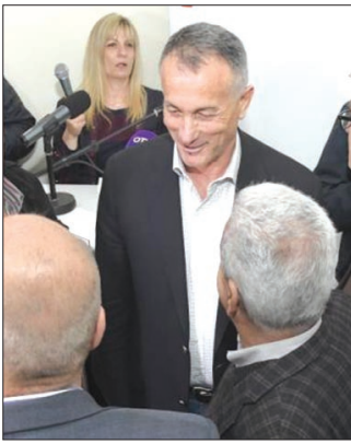
روكز في افتتاح مكتب ريفون

اللبنانيين الأودم!!! «ليكون الصوت التفضيلي لرئيس الجمهورية» وبهدف حثهم على منحه «الصوت التفضيلي» قال: «...» يارادتمك ووجودكم وتحديكم نصل إلى تكتل نيابي كبير ليكون الصوت التفضيلي لرئيس الجمهورية!!!