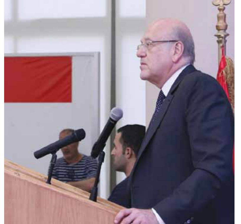
الرئيس نجيب ميقاتي يلقي كلمته

معوّض. وهذه الخطة تشكّل المحور الأساسي للكتاب وستتابع تطوير كافة المشاريع الإنمائية ليتعزز دور ومكانة طرابلس في عملية الإنماء والنمو والنهوض الإقتصادي الشامل».