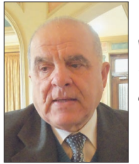
بقلم اللواء أ.د. أمين عاطف صليبا