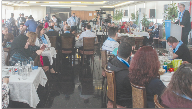
خلال اطلاق الماكينة الانتخابية في القلمون