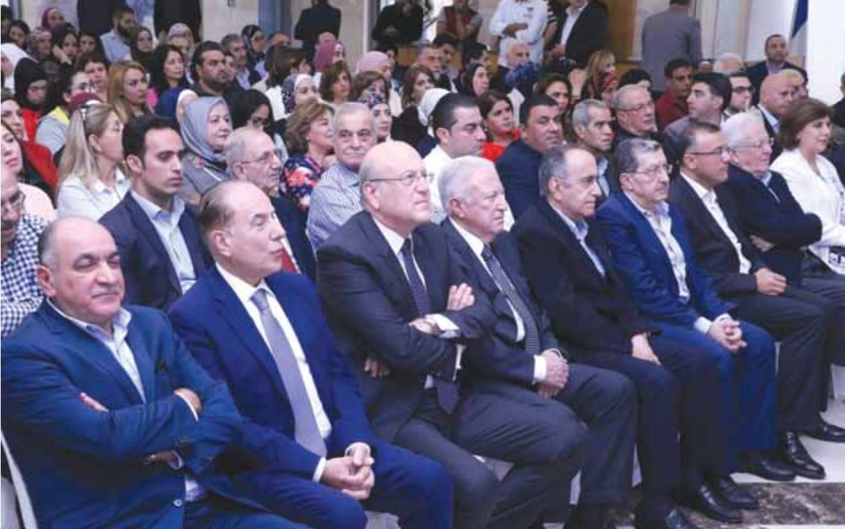
مقدم حضور الاحتفال