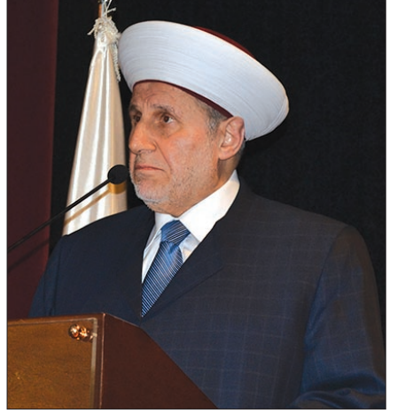
المفتي الشاعر متحدثاً

وموضوعية ودفاع عن مواقف سماحته وأقواله ومفرداته دون أن يلحق بأي منها أي سائبة أو إساءة.