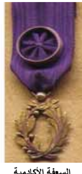
السعفة الأكاديمية من رتبة ضابط